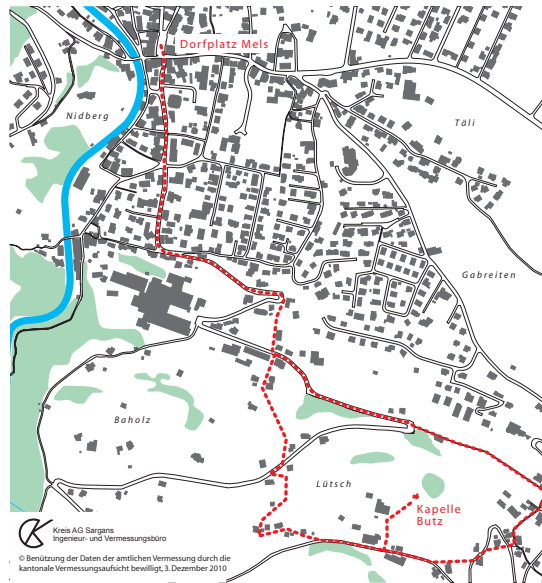
Fussweg zur Antoniuskapelle Butz

Regina Hobi-Habicher, Kapellmesmerin, Butzerstrasse 128, 8887 Mels, 081 723 29 84 Politische Gemeinde Mels, Gemeinderatskanzlei Rathaus, 8887 Mels, 081 725 30 30 gemeindevverwaltung@mels.ch