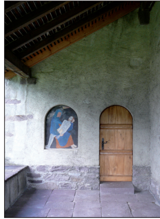
Todesleid der PIETA